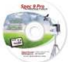
スペック9プロ 型式:3654P9