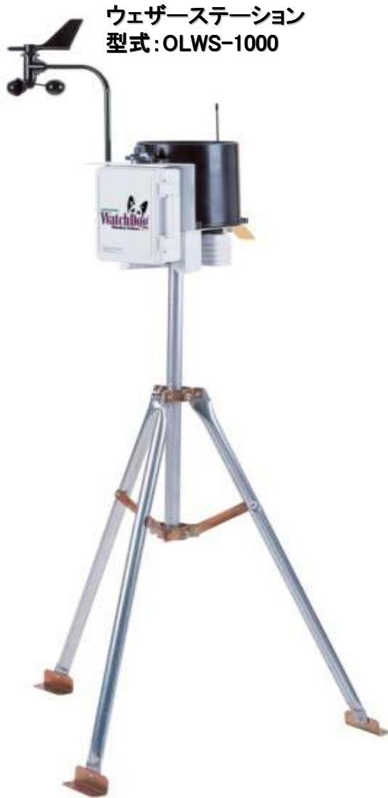
ウェザーステーション 型式:OLWS-1000